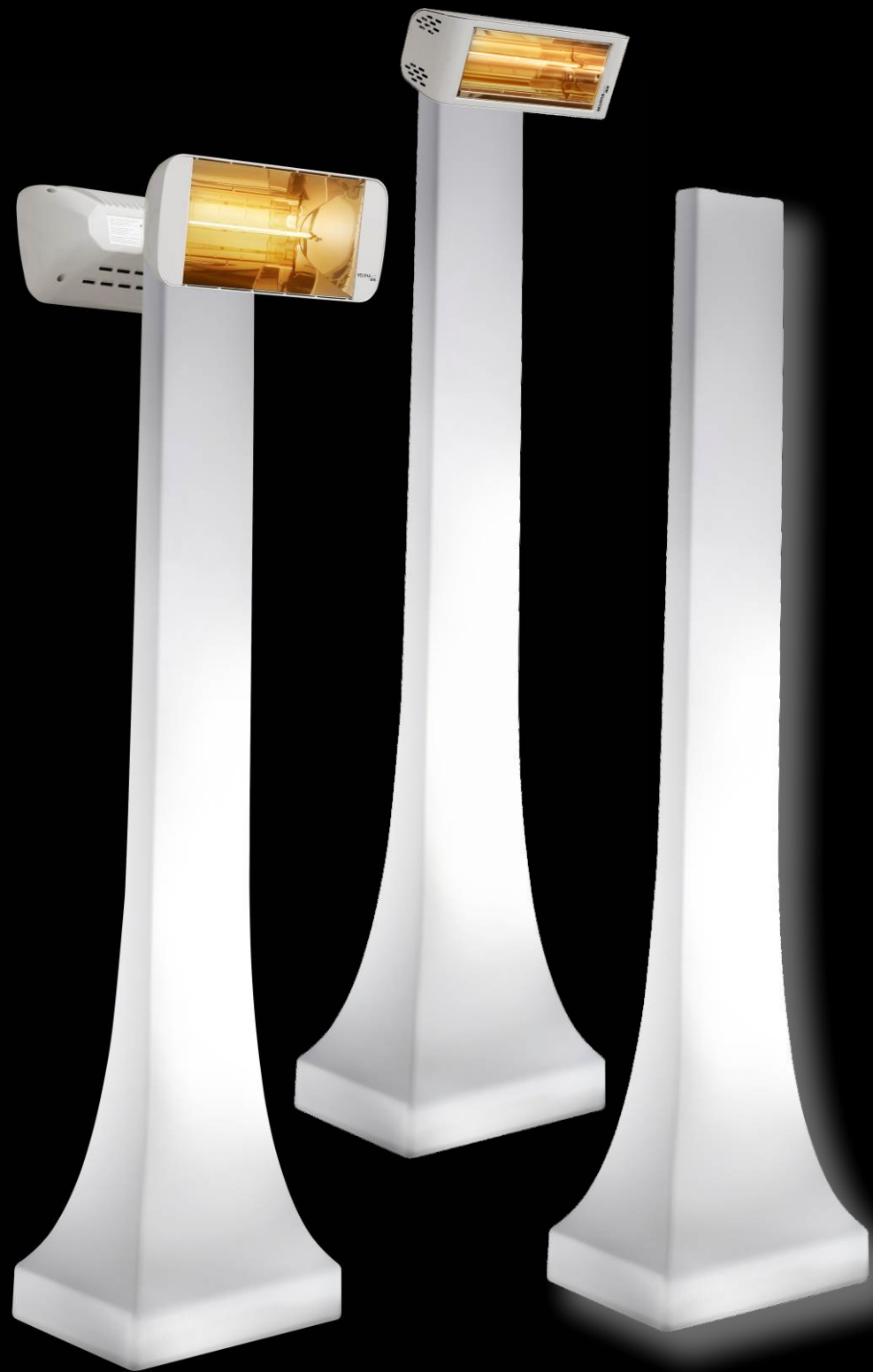
Obelisk Lighting mit oder ohne Heliosa 66

keine kühle Abende mit einer INFRAROT HEIZUNG HELIOSA 66